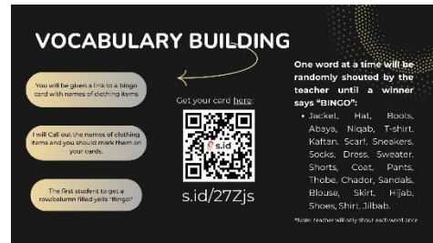
Gambar 1. Permainan Bingo interaktif

interaktif dapat meningkatkan partisipasi dan keterlibatan pembelajar.