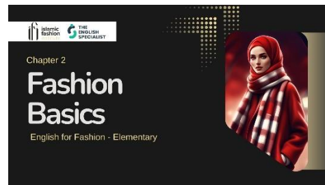
Gambar 2. Laman muka unit 2

Materi dalam bab ini menjawab kebutuhan kosakata dasar tentang pakaian dan bahan seperti tergambar dalam laman muka di Gambar 2. Desain kegiatan berbasis gambar dan deskripsi singkat dirancang untuk memperkuat keterampilan reading dan writing dasar yang sangat penting dalam tahap A1 menurut CEFR.