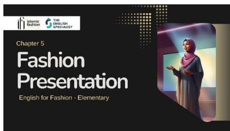
Gambar 5. Laman muka bab 5

Secara keseluruhan, struktur kelima bab menunjukkan konsistensi dalam penerapan pendekatan ESP yang berbasis konteks dan kebutuhan nyata peserta didik. Penyusunan materi secara visual, terintegrasi dengan latihan interaktif, menunjukkan potensi besar dalam menciptakan bahan ajar yang menarik, fleksibel, dan sesuai dengan perkembangan teknologi pembelajaran. Materi ini juga berkontribusi pada penyediaan sumber belajar bahasa Inggris yang inklusif secara budaya dan relevan dengan kebutuhan industri fesyen Islami di Indonesia.