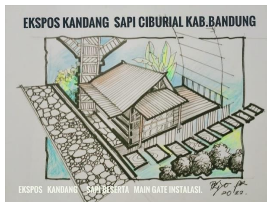
Gambar 6 Ekspos Kandang Sapi

Traffic Tracking ditujukan untuk tamu/ pengunjung keluarga, atau anak sekolah yang ingin mencoba untuk wisata edukasi berkebun mulai dari penanam, pemupukan, pengairan, dan panen bias dilayani berdasarkan jadwal. Adapun traffic tracking dimulai dari Parkir kemudian jalan kaki melalui gerbang utama yang dibuat menggunakan bambu, kemudian istirahat untuk minum susu di kandang sapi, kemudian melanjutkan jalan lahan perkebunan dan menikmati karedok di stage sambil melihat flora dan fauna di sekitar lokasi.