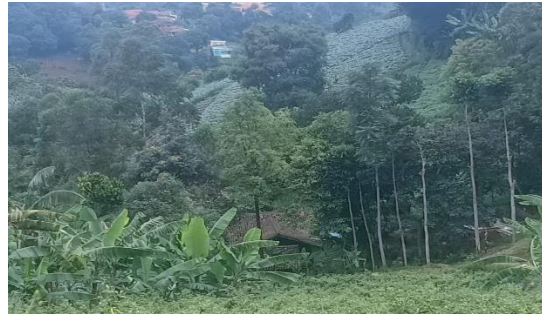
Gambar 1 : Lahan Milik masyarakat

Konsep Pengembangan Agro wisata dan budaya di Desa Ciburial untuk awal perencanaan ini di fokuskan di Dusun IV RW 10 Kordon II Ciharegem, Cihregem Puncak terdiri dari 4 RT. Adapun Peta Lokasi Adapun Siteplan dari lokasi studi adalah lingkaran merah RW 10 dan batas tanah serta tapak dari rencana lokasi dapat di lihat pada gambar dibawah ini Peta batas Lokasi Milik Bapak Ilham Habibie seluas 8.000 M2 berada di dekat Obyek Wisata Tebing Keraton, dan berbatasan dengan Gardu Pandang Tebing Keraton di RW 10 Dusun IV Kordon II Ciharegem, Cihregem Puncak, Desa Ciburial Kecamatan Cimenyan Kabupaten Bandung. Dari Survey Lokasi saat ini tanaman yang ada adalah, Kol, Cabe, Umbi-umbian, kacang panjang, dan Pisang.