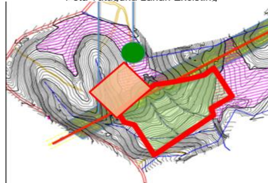
Gambar 3 : Peta Tataguna dan Kontur Lahan