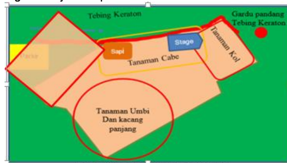
Peta Tataguna Lahan Existing

Strategi pengembangan Agro Wisata dan Budaya di Desa Ciburial dilakukan melalui pembangunan pusat-pusat wisata budaya dan agro yang ada di RW 10 terdiri dari 4 RT. Kelurahan Ciburial sendiri diarahkan sebagai Desa Wisata yang berfungsi sebagai pengembangan Wisata Agrodan Wisata Budaya. Rencana pengembangan kawasan yang direncanakan saat ini adalah lahan milik Bapak Ilham Habibie dengan luas 8.000 M2 dengan fungsi saat ini adalah lahan Pertanian sehingga sangat menarik apabila dikembangkan menjadi destinasi agro wisata dan agro budaya sesuai dengan kebijakan spasial