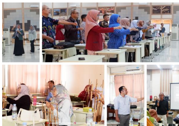
Gambar 2. Pelaksanaan PKM

Pada kegiatan selanjutnya yaitu, tahapan latihan praktek penerapan kombinasi peragaan hand sign untuk angklung melodi dan hand sign untuk angklung iringan yang dipergakan secara bersamaan dengan menggunakan media angklung.