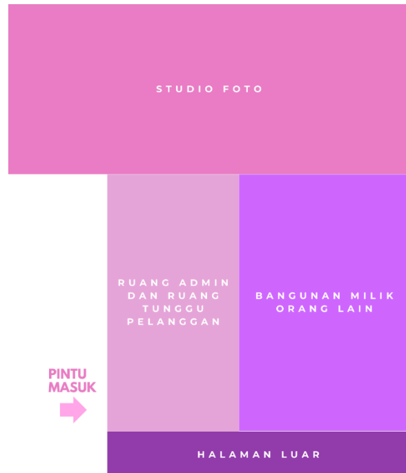
Gambar 1. Tata ruang Nala Self Foto Studio cabang Cikutra

Berdasarkan hasil observasi di Nala Self Foto Studio cabang Cikutra, ditemukan bahwa tata ruang kantor cabang tersebut menggunakan tata ruang terbuka, yaitu pada area administrasi dan ruang tunggu. Hal ini terlihat dari penempatan karyawan dan pengunjung dalam satu ruangan tanpa adanya sekat pembatas. Walaupun demikian, terdapat ruangan tertutup seperti studio foto yang memiliki fungsi khusus.