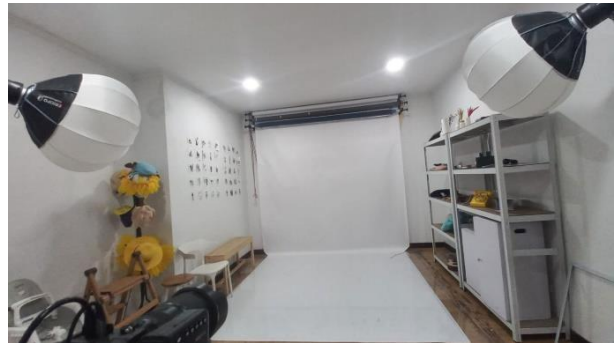
Gambar 4. Ruang studio foto Nala cabang Cikutra

dapat mengurangi kenyamanan pelanggan. Hal tersebut juga dapat membuat kerapihan ruangan berkurang.