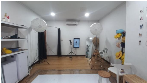
Gambar 3. Ruang studio foto Nala cabang Cikutra

Penataan peralatan di ruangan studio foto telah disesuaikan dengan kebutuhan pelanggan. Setiap peralatan, mulai dari kamera hingga lampu studio dan juga aksesoris saat berfoto, ditempatkan sedemikian rupa sehingga memudahkan akses bagi karyawan maupun pelanggan. Namun, terdapat masalah pada pengelolaan kabel yang terurai di lantai studio. Kondisi ini tidak hanya mengganggu estetika ruangan, tetapi juga berpotensi menimbulkan bahaya tersandung.